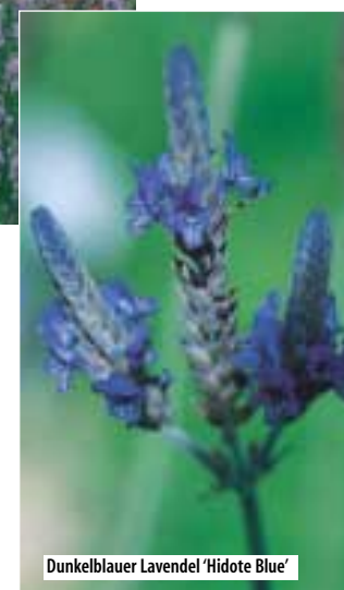
Dunkelblauer Lavendel 'Hidote Blue'