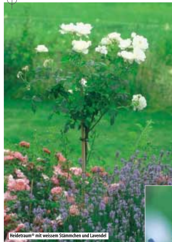
Heidetraum® mit weissem Stämmchen und Lavendel